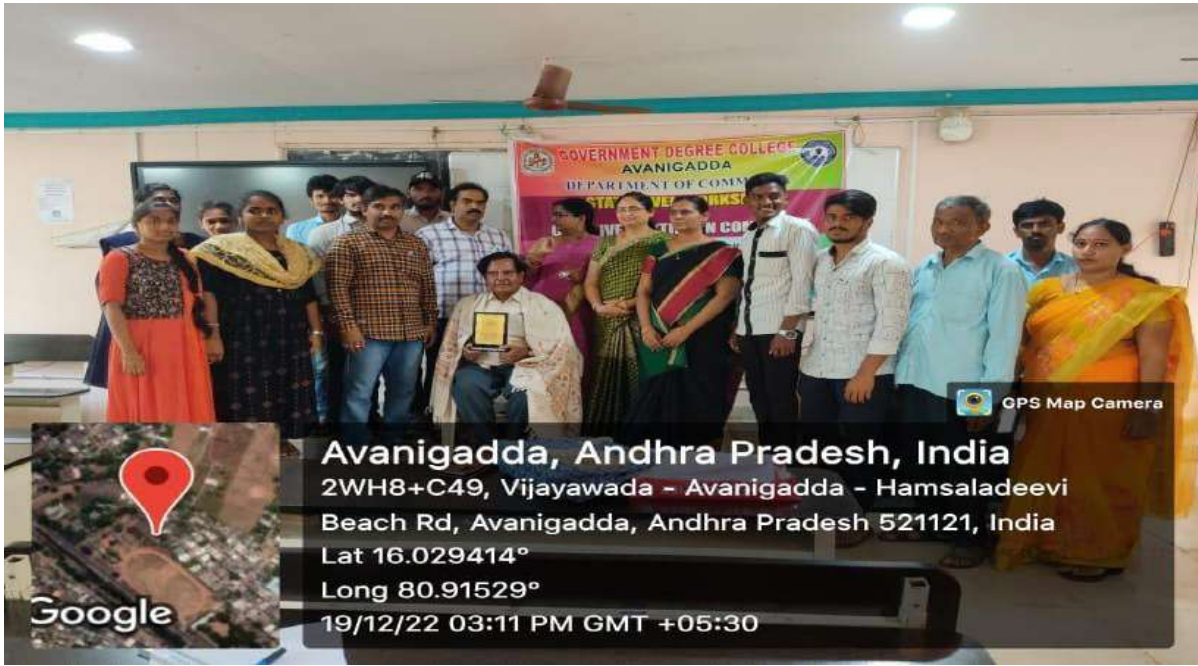
Felicitation to the Special Invitee Speaker