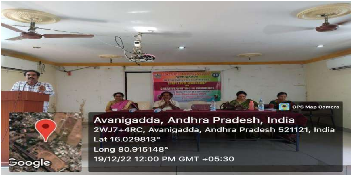
Objectives of the Workshop by the Convener