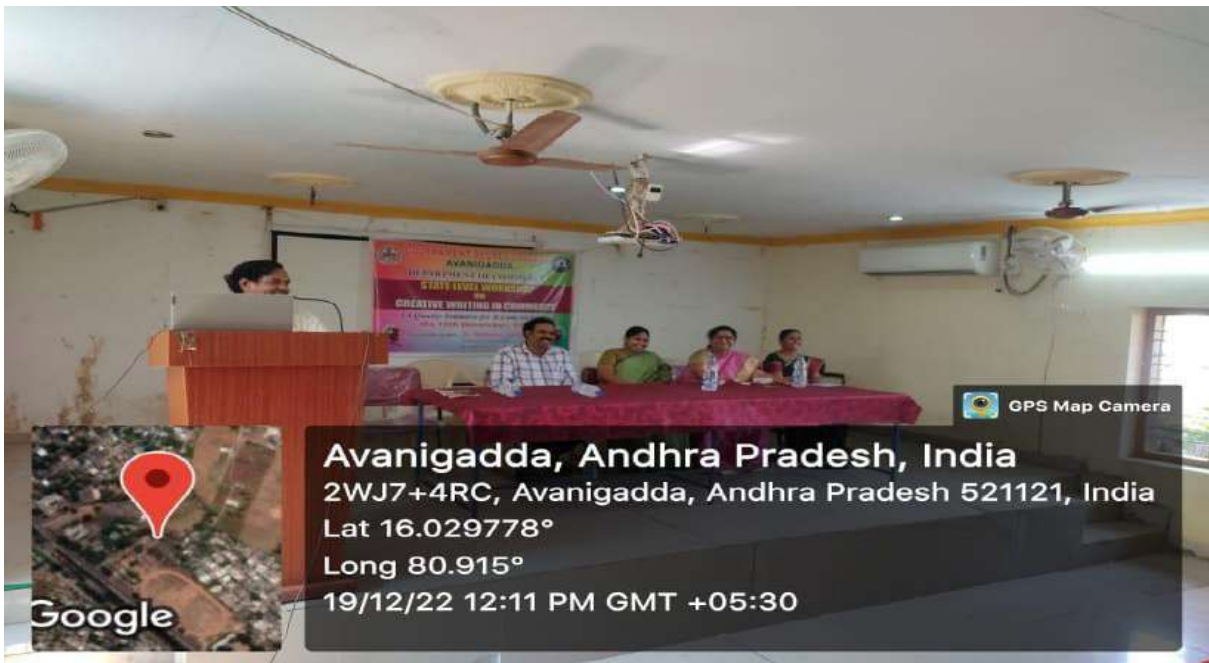
Address by the Special Invitee Speaker