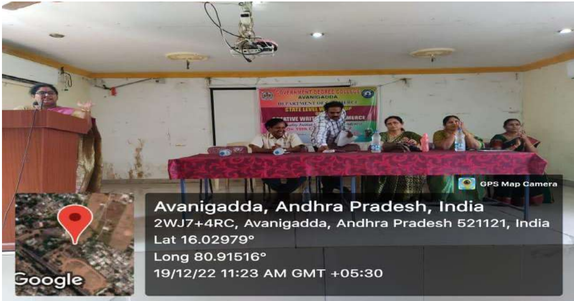
Welcome Address by the Principal