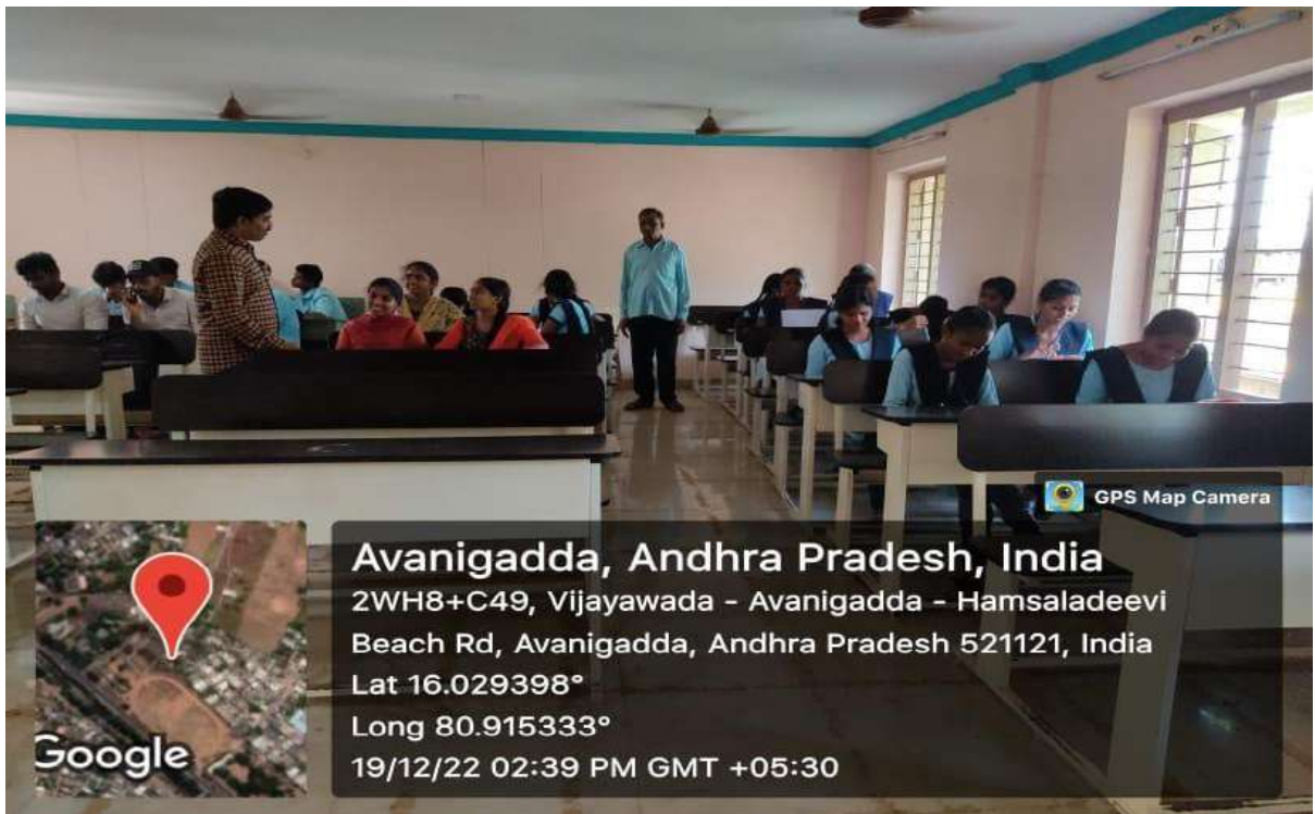
Students participating in workshop

Avanigadda, Andhra Pradesh, India 2WH8+C49, Vijayawada - Avanigadda - Hamsaladeevi Beach Rd, Avanigadda, Andhra Pradesh 521121, India Lat 16.029398° Long 80.915333° 19/12/22 02:39 PM GMT +05:30